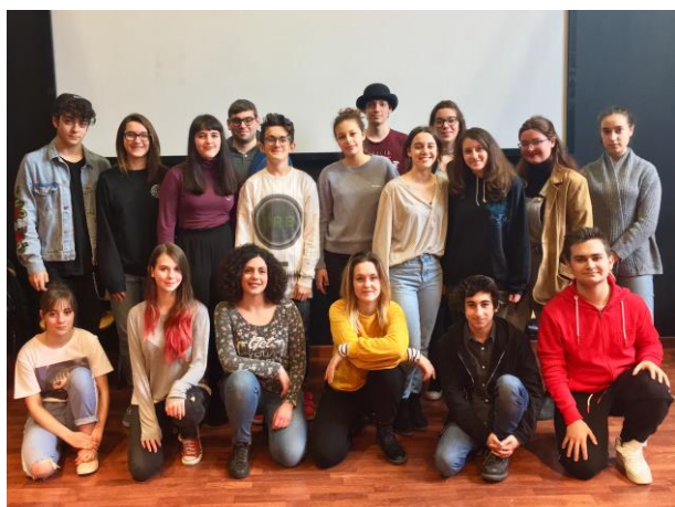
Festival 2018: la Giuria di ragazzi e ragazze

Il Festival delle Scuole è un Concorso di Teatro a cui sono ammessi, previa compilazione della domanda allegata, gruppi di teatro delle Scuole Secondarie di 2° grado . Il Concorso si svolge durante il mese di maggio e la Cerimonia di Premiazione dei vincitori si tiene domenica 26 maggio 2019 all'ITC Teatro di San Lazzaro. L'iscrizione è gratuita . Per partecipare è sufficiente, dopo aver letto il bando di concorso, compilare e firmare il modulo di iscrizione e la scheda di partecipazione allegati e inviarli con le modalità e nei tempi indicati. I gruppi partecipanti si esibiscono davanti a una giuria composta interamente da ragazzi e ragazze , provenienti da tutte le scuole in concorso, che dovranno valutare testo e recitazione, grado di difficoltà e originalità, costumi, scene e musiche degli spettacoli in gara. La giuria è senz'altro una delle cose più belle nonché il simbolo di questa rassegna dedicata ai più giovani. Al termine della manifestazione, la scuola prima classificata riceverà un premio in denaro pari a euro 1.500 , che la scuola si impegna a spendere nell'organizzazione di attività culturali destinate agli allievi, nonché il diritto a partecipare all'edizione 2020 della Manifestazione Teatro Lab organizzata dal Centro Teatrale Europeo Etoile sul territorio della Provincia di Reggio Emilia.