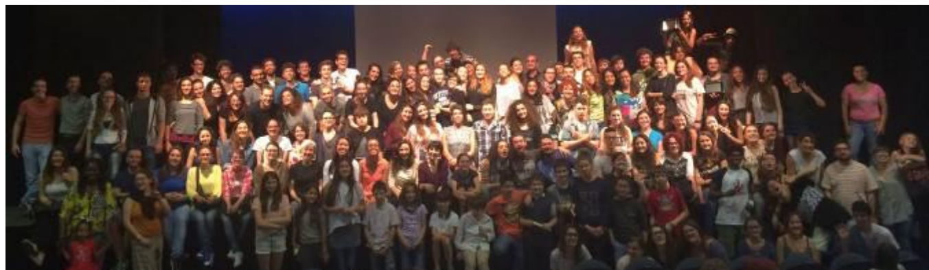
La celebrazione dei vent'anni del Festival con i partecipanti delle passate edizioni, dal 1995 al 2015

2017 - grazie all'esperienza pluri-ventennale nelle scuole, nasce Futuri Maestri , progetto dedicato a bambine, bambini e adolescenti dai 3 ai 18 anni