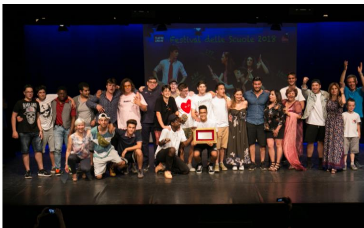
I vincitori dell'edizione 2018: Istituto Leonardo da Vinci di Mantova